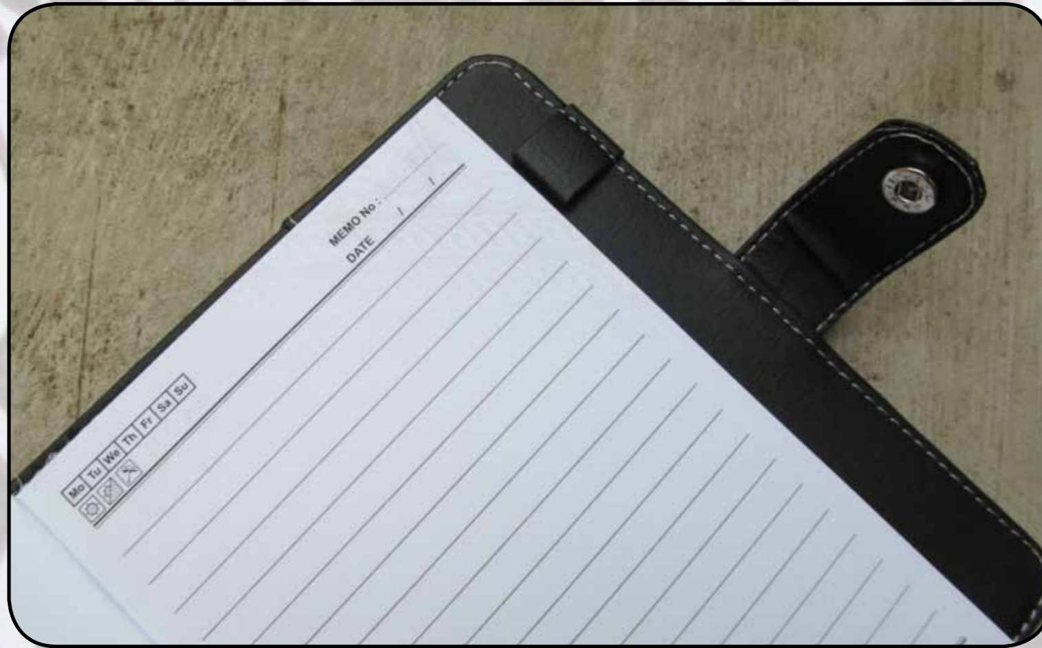
POJOK KANAN : kertas buku dicetak semu motif batik.