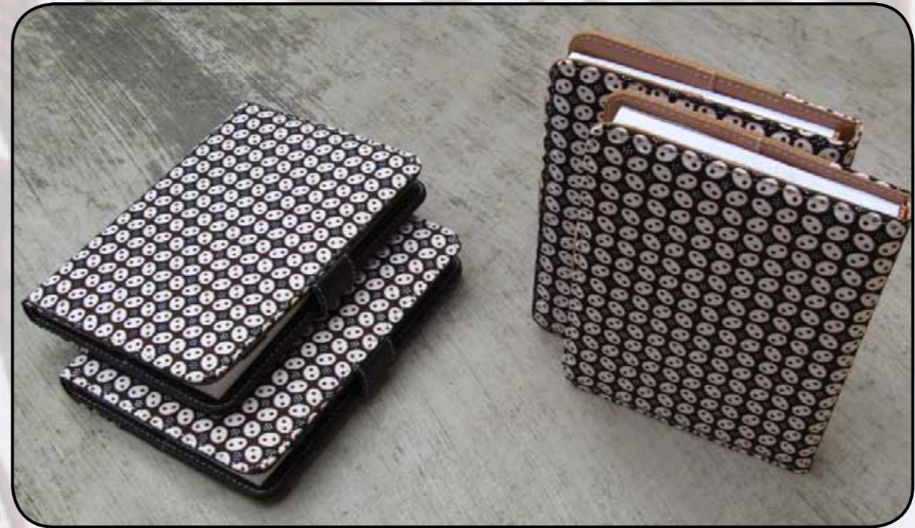
BUKU AGENDA BATIK : Tampak belakang.

Di tahun 2013 ini, Kami kembali menghadirkan produk batik terkini untuk komunitas pecinta batik di Tanah Air. Kali ini, motif batik kami hadirkan pada buku agenda. Bagi Anda yang menginginkan seminar kit atau alat tulis kantor