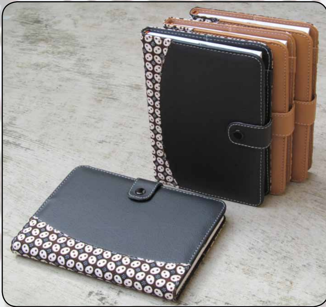
BUKU AGENDA BATIK : Tampak depan.